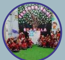
Semana de la lectura