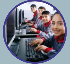
Sala de cómputo