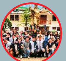
Viaje de promoción